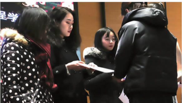
蚌埠学院微信公众号获评安徽高校“十佳微信公众号”

中国高校传媒联盟是在共青团中央、教育部指导下,由中国青年报社发起成立的校园媒体联合组织,全国会员媒体已有 5000 余家。中国(安徽)高校传媒联盟是在共青团安徽省委的关心和支持下,由中国青年报安徽记者站发起成立,目前覆盖安徽所有本科高校。